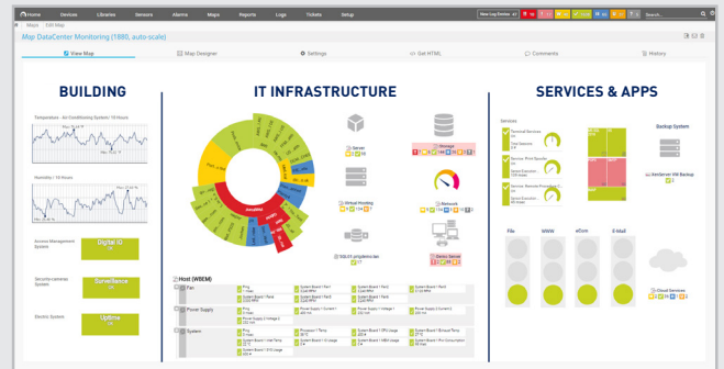
Mit PRTG-Maps individuelle Dashboards erstellen